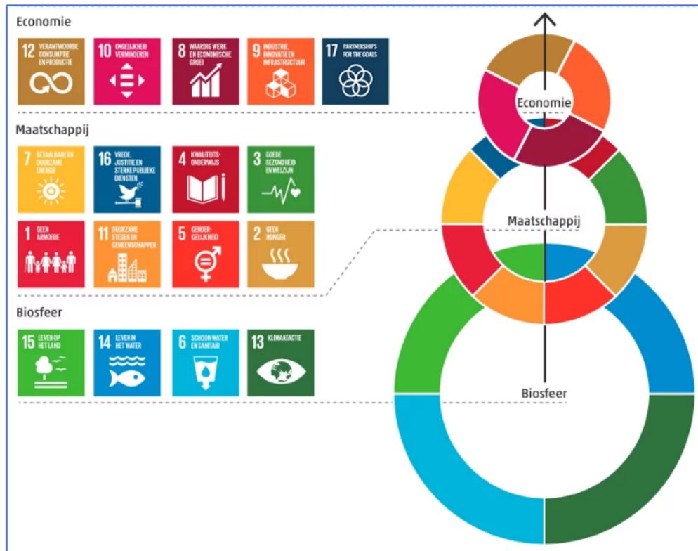
Koppeling van de SDG's aan enkele overkoepelende brede welvaartthema's

Waar zetten we op in voor 2024? Op het voortvarend oppakken van woningbouw. Op het realiseren van bedrijventerreinen en het verhogen van de verkeersveiligheid. Op het vergroten van de leefbaarheid door het stimuleren van sport en cultuur en het laten meedoen van iedereen. Op veiligheid, economie en toerisme. Op armoedebestrijding, aanpak van droogte en vermindering van afvalstromen. Op inclusie en onderwijs. En op zorg voor hen die dat nodig hebben. Dit alles vanuit een gedeelde verantwoordelijkheid. We weten dat belangen tegengesteld kunnen zijn. Dit vergt een rechte rug. Durven vasthouden aan keuzes. Ook als individuele belangen niet helemaal overeenkomen met de collectieve doelen.