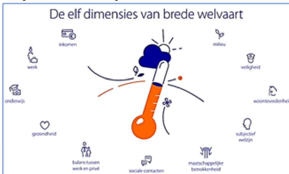
De elf dimensies van brede welvaart

Een wereldwijd geaccepteerd samenhangend stelsel van 17 doelen die ons helpen verder op weg te gaan richting een duurzame samenleving.